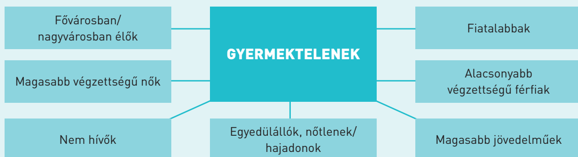
2.ábra. A gyermekvállalást nem tervezők jellemzői

A vizsgált kutatások közös jellemzője, hogy többségük főként a nők gyermektelenségére összpontosít (Szalma és Takács 2012), de az utóbbi időben az önkéntesen gyermektelen férfiak vizsgálata is kezd előtérbe kerülni a kérdéskörön belül (Kis 2018), ahogyan a gyermektelenek egy sajátos csoportját jelentő „szinglik többsége (is) férfi” (Rövid, 2018: 314). Ennek többek között az is lehet az oka, hogy a férfitöbbslet egészen az 50-es életévek elejéig kitart a népességben (Rövid, 2020). Bár „a gyermektelenek nem alkotnak homogén csoportot” (Szalma és Takács 2016:165), vannak közös jellemzőik. A gyermekvállalást nem tervezők között felülreprezentáltak a magasabb iskolai végzettségű nők, az alacsonyabb végzettségű férfiak, a fiatalabbak, a fővárosban, illetve nagyvárosokban élők, a magasabb jövedelemmel rendelkezők, a nem hívők és természetesen az egyedülállók, a nőtlenek/hajadonok (Bencze 2023, Pári és Balog 2022). Mind közül „a fővárosi, diplomás nők a legesélyesebbek arra, hogy 40-45 éves korukban gyermektelenek legyenek” (Makay et al. 2019:79).