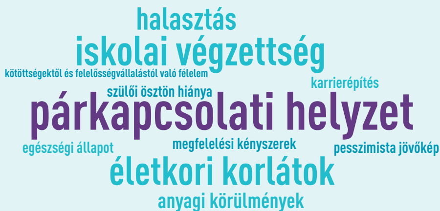
3. ábra: A gyermektelenséget befolyásoló legmeghatározóbb tényezők

Az alábbiakban azokat a főbb okokat, tényezőket, érveket fejtem ki, amelyek „a gyermekvállalás ellenében” (Pári et al. 2022: 184) hatnak.